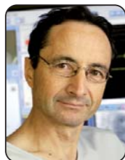
Michel HAISSAGUERRE Bordeaux

Tracé n°1 : Anomalie de la fin des QRS, moins abrupte, soit avec un empatement soit avec un crochetage ressemblant à une onde delta terminale. Elle est au moins > 1mm par rapport à la ligne de base soit 0,1mv et ne doit pas être notée dans les dérives V1, V2, V3 afin d'éviter une confusion avec un Brugada, mais dans les dérives inférieures ou latérales.