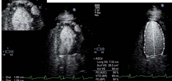
Fig.2 : A gauche : Epreuve de contraste avec opacification de la zone arrondie correspondant à un petit faux anévrisme. A droite : Contraste ventriculaire gauche avec calcul de la fraction d'éjection en 4 cavités.

Une épreuve de contraste par voie veineuse périphérique est réalisée, en utilisant un contraste ayant la propriété de passer la barrière pulmonaire et opacifier les cavités gauches (Sonovue). Le contraste opacifie la cavité ventriculaire gauche et en même temps cette néo cavité, sans extension dans le péricarde (fig.2).