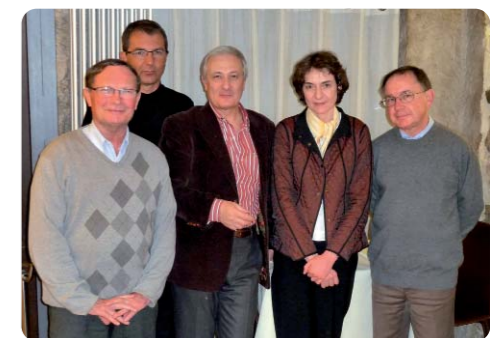
Le bureau de l'ARHOCARD